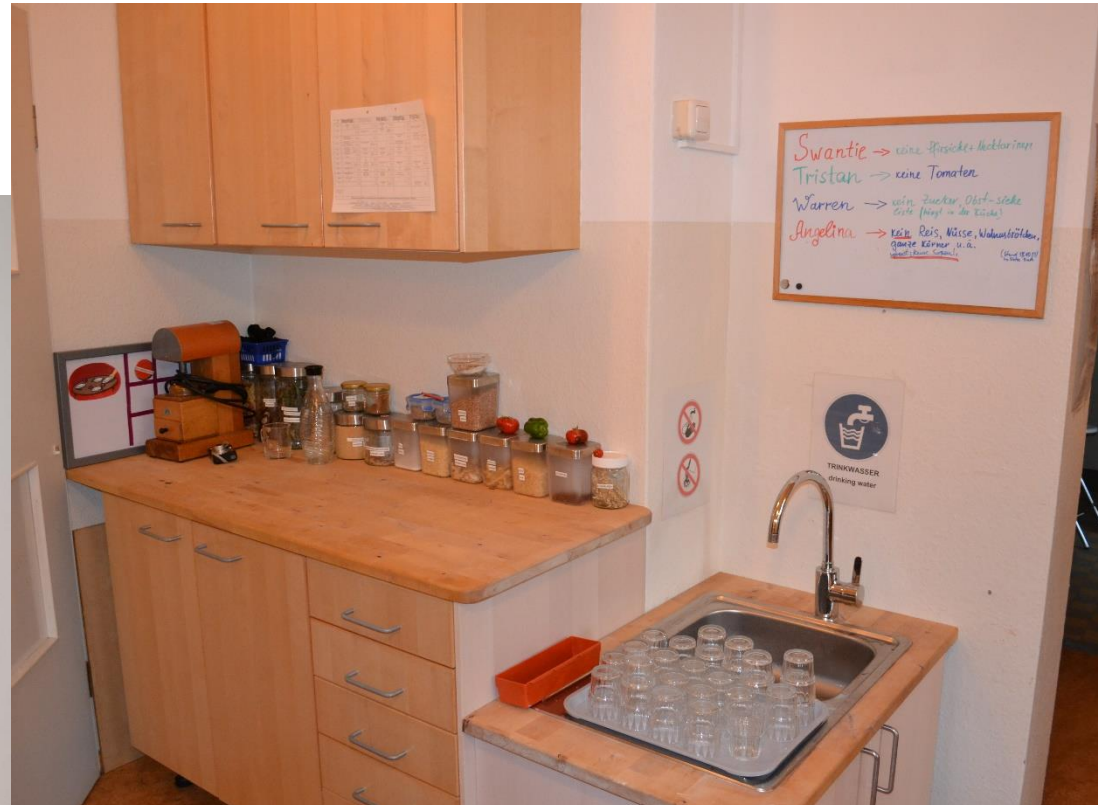
Die kleinen Strolche und Noldering Kinderwelt HH e.V.