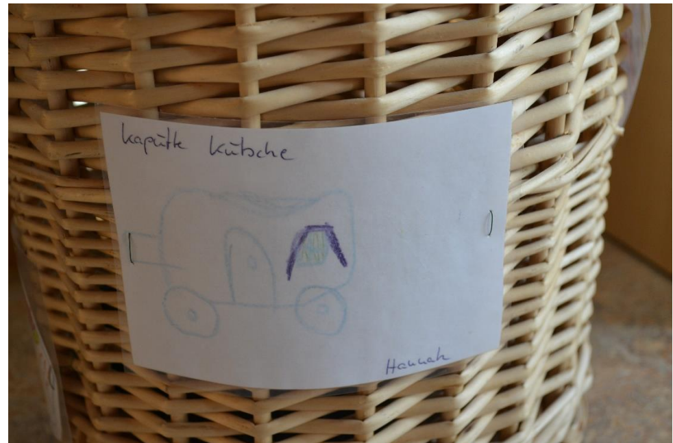
Städtische Kita Kämpenstraße, Essen