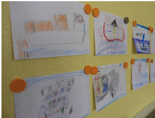
Wie kommt Plastik ins Meer?

Kita Zeisigweg in Dreieich: Ausstellung „Plastik – nein danke!“