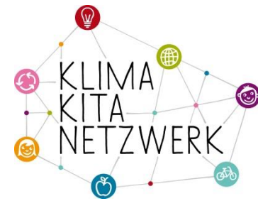
Konsultations-Kita der Region Süd: Kita kleine Farm Bobingen