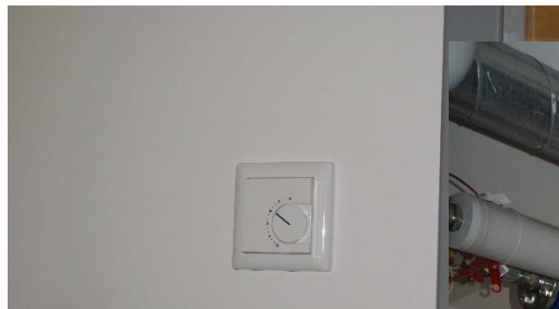
Rot-Kreuz- Kita Abenberg