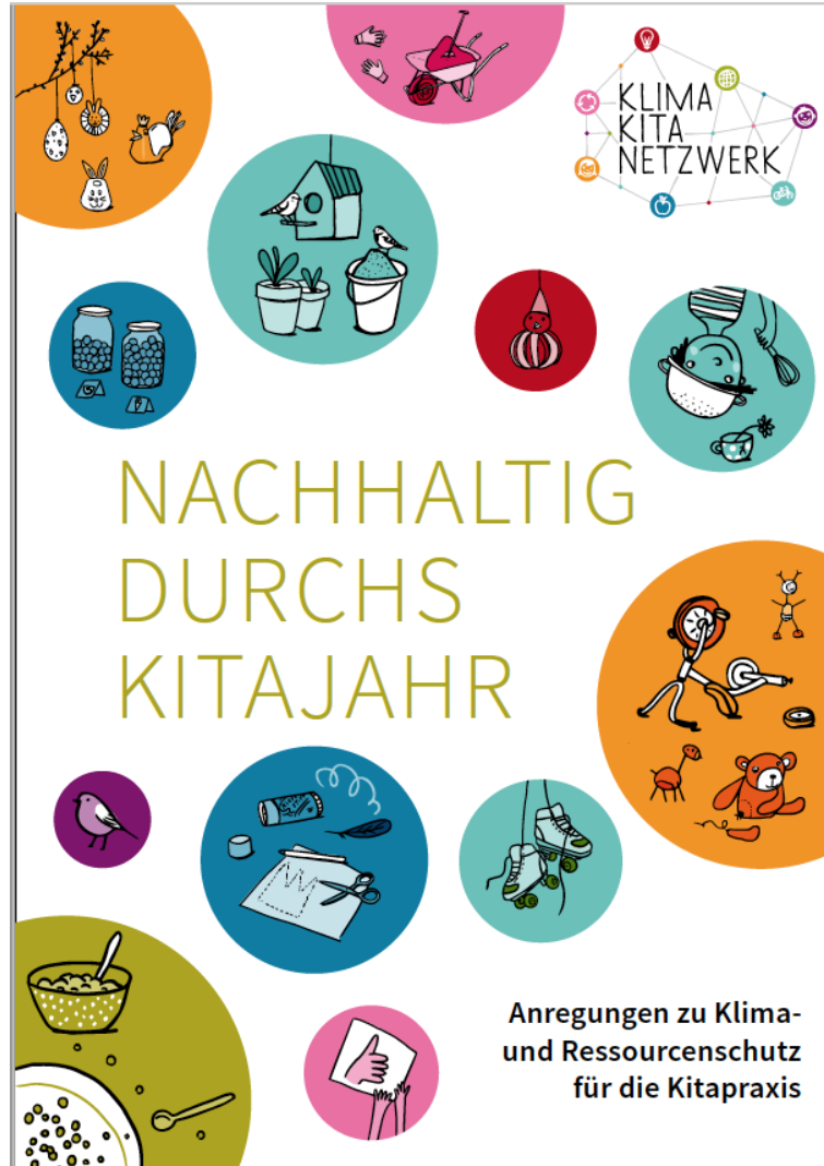
Foto: Ausschnitt Titelseite Praxishandbuch für Kitas

Broschüre kostenlos zum Herunterladen unter: https://klima-kita-netzwerk.de/wp-content/uploads/KKN_Broschuere_Nachhaltig-final.pdf